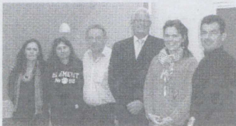
Esforço da comitiva cantanhedense para estar presente no encontro foi elogiado

Após chegada a Frederikssund os dirigentes da Sociedade Columbófila, que se deslocaram para a