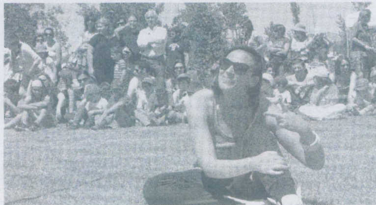
NO ANO passado o Parque de S. Mateus recebeu pela primeira vez a Festa da Criança

O novo figurino adoptado, à semelhança do ano passado, para festejar uma efeméride inteiramente dedicada aos mais novos é de molde a proporcionar-lhes a oportunidade de desfrutarem de um vasto leque de experiências conjuntamente com a família e os professores no “pulmão verde” da cidade: o Parque de S. Mateus.