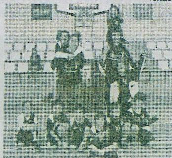
Olivais Coimbra 2