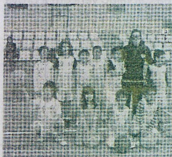
Olivais Coimbra 1

Juventude Seis equipas evoluíram no Pavilhão Augusto Correia e no final todas saíram “vitoriosas”