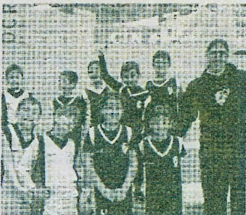
União Futebol de Buarcos