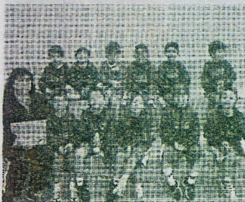
Academia de Basquetebol