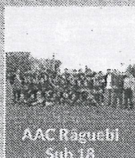
AAC Paguebi Sub 18