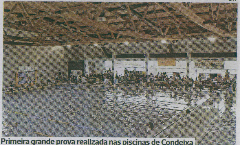
Primeira grande prova realizada nas piscinas de Condeixa

malicão ocuparam, respetivamente, os três primeiros lugares do pódio na classificação final coletiva.